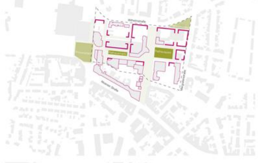
Gliederung Einteilung des Gesamtquartiers in Teilbereiche M 1:5000