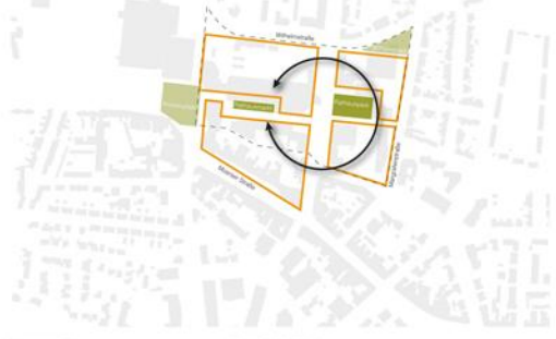
Nutzungen Entwicklung von Schwerpunktbereichen M 1:5000